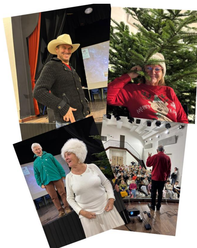
Photographie 2 Annie Cabon