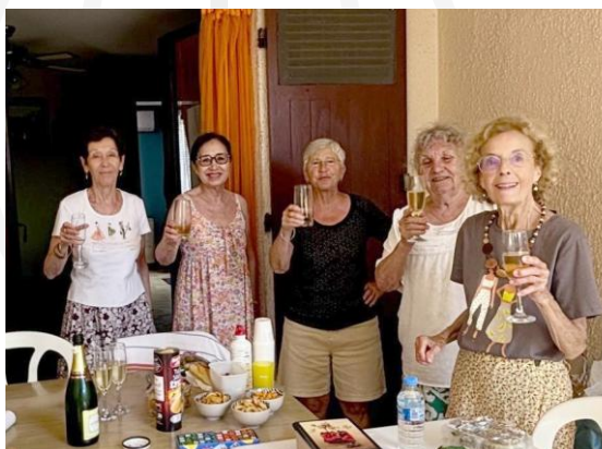
Photographie 1. Les hommes s'étaient cachés